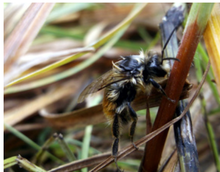
Insecte ou Arachnide