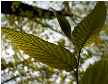
Feuille à bord denté