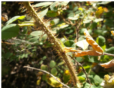
Quelque chose de pointu